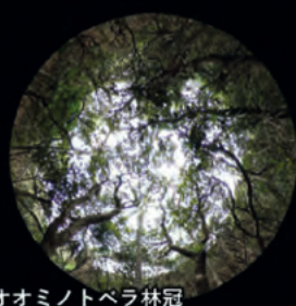
オオミノトベラ林冠