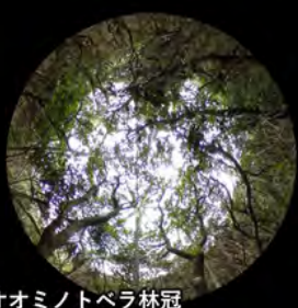
オオミノトベラ林冠