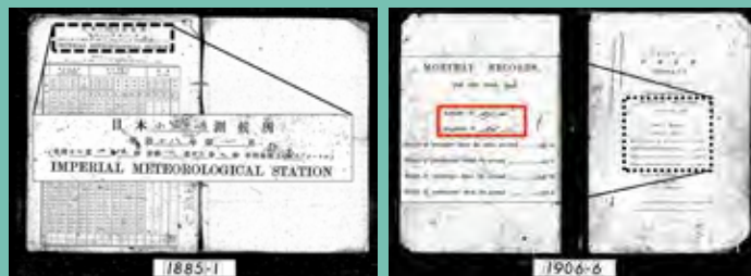
小笠原嶋測候所における1885年1月と1906年6月の地上気象観測原簿 (気象庁提供の資料を加工)

明治時代の父島の気象観測の場所(緯度・経度にまつること)と、第二次世界大戦中に母島に設置された母島観測所についてお話しします